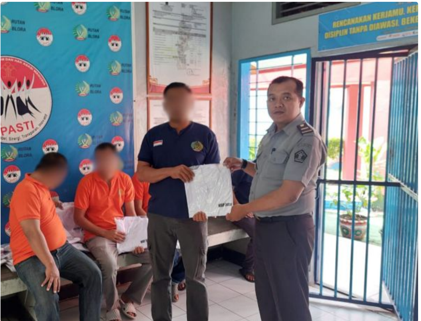
Rutan Blora Bagikan Baju Muslim sebagai Dukungan Pembinaan Spiritual Warga Binaan

Blora – Rumah Tahanan Negara (Rutan) Kelas IIB Blora melaksanakan kegiatan pembagian baju muslim kepada warga binaan pada Selasa (17/12/2024). Kegiatan ini merupakan bagian dari program pembinaan yang bertujuan