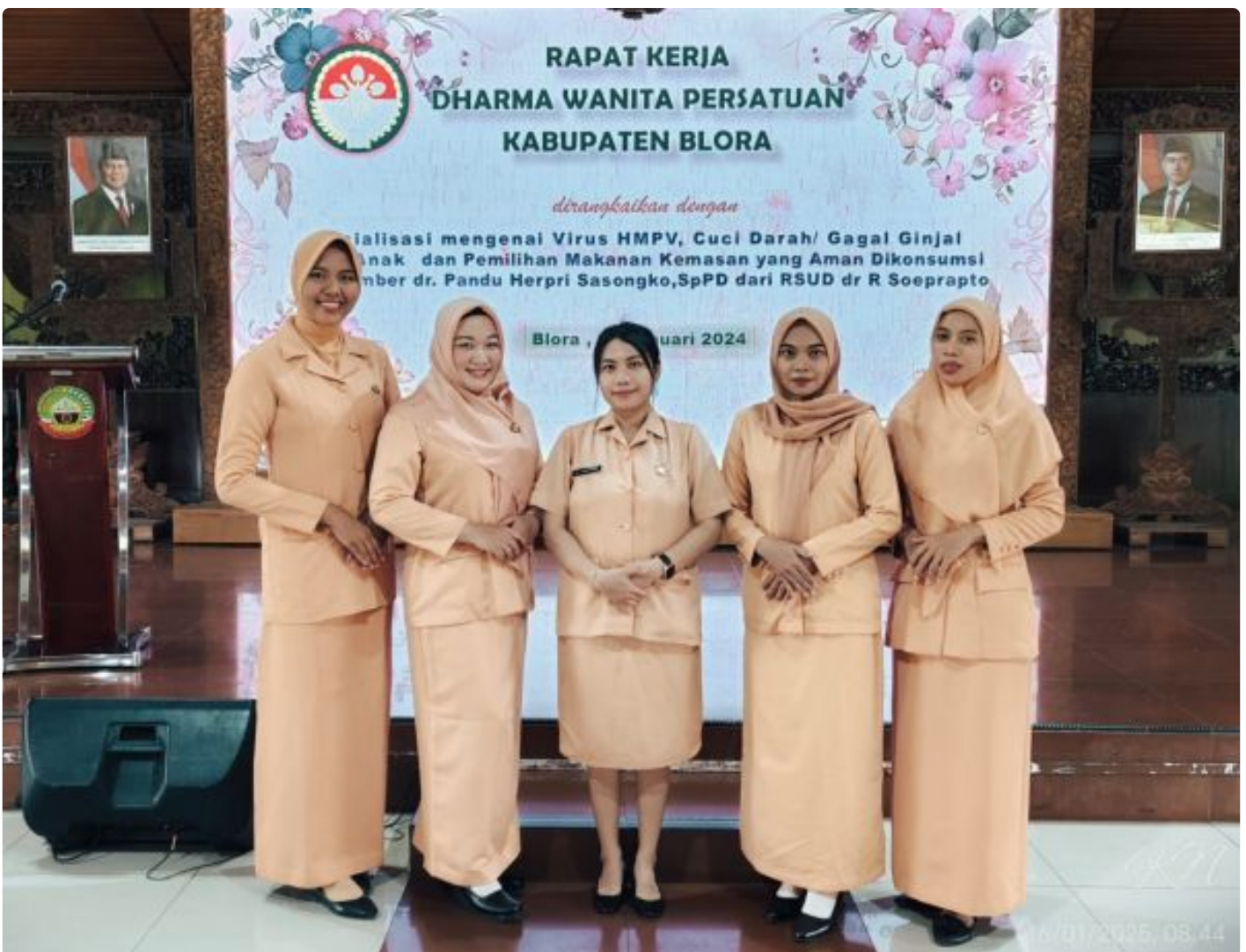
DWP Rutan Blora Hadiri Rapat Kerja DWP Kabupaten Blora dan Sosialisasi Kesehatan

Blora - Bertempat di Pendopo Rumah Dinas Bupati Blora, Dharma Wanita Persatuan (DWP) Rumah Tahanan Negara (Rutan) Kelas IIB Blora Kantor Imigrasi dan Pemasyarakatan mengikuti kegiatan Rapat Kerja DWP Kabupaten